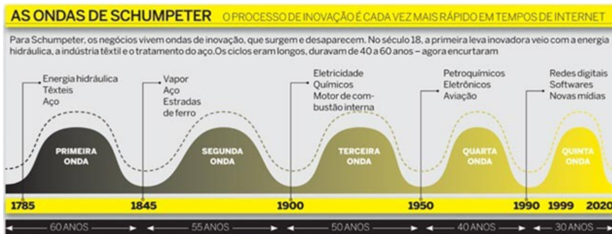
Figura 2 - As ondas de Schumpeter – O processo de inovação.